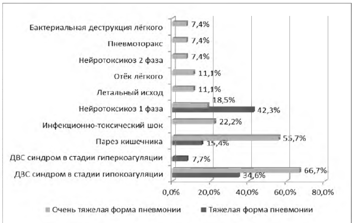
Рисунок 3.2. - Осложнения пневмонии у новорождённых с тяжёлой и очень тяжёлой пневмонией

Лёгочные осложнения пневмонии отмечались только у детей второй группы, так, бактериальная деструкция лёгкого была выявлена у 2 (7,4%) новорождённых, отёк лёгкого был у 3 (11,1%), инфекционно-токсический шок отмечался у 6 (22,2%), пневмоторакс - у 2 (7,4%). Данные представлены на рисунке 3.2.