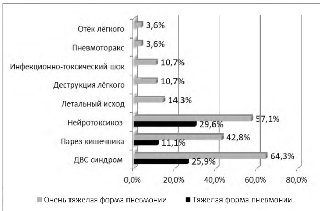
Рисунок 3.3. - Осложнения пневмонии у детей первого года жизни с тяжёлой и очень тяжёлой пневмонией

отмечался в 4 (14,3%). Данные осложнения пневмонии отражены на рисунке 3.3.